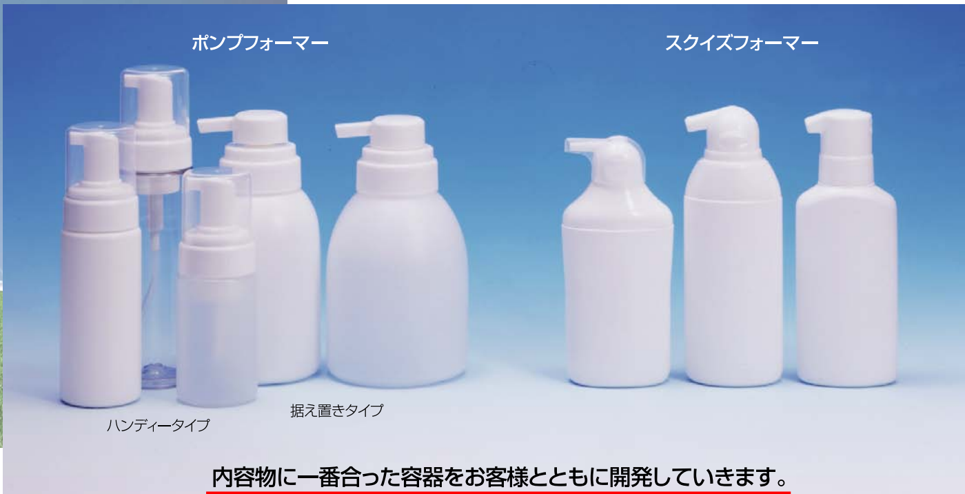
ポンプフォーマー